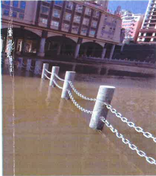
白石河入汉江断面