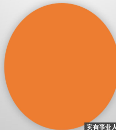
2022年底单位实有人员情况