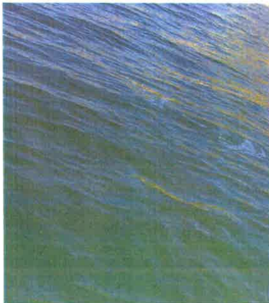
汉江羊尾国控断面