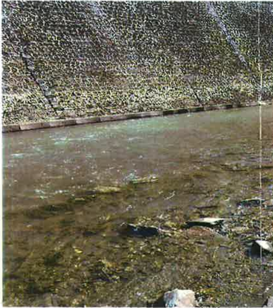
白石河入汉江断面