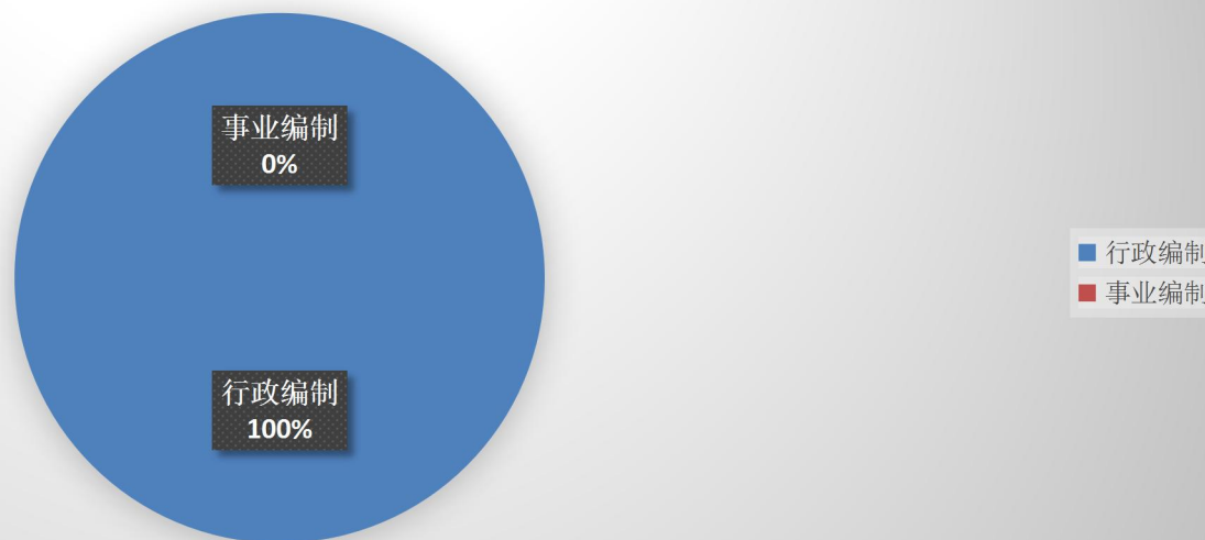
2020年底单位人员编制情况

截止2020年底，本部门人员编制6人，其中行政编制6人、事业编制0人；实有人员5人，其中行政5人、事业0人。单位管理的离退休人员0人。